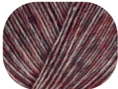
berry meliert 00084