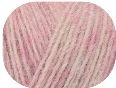
rosé meliert 00030