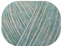
mint meliert 00062