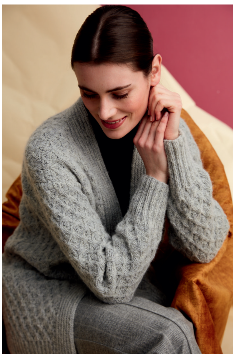
TOROSAY Cardigan R0463 REGIA PREMIUM Alpaca Soft, col. 00090