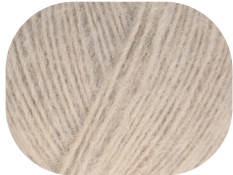
natur meliert 00002