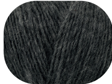
anthrazit meliert 00095