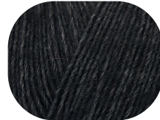
schwarz meliert 00099