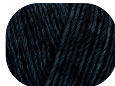
nachtblau meliert 00055