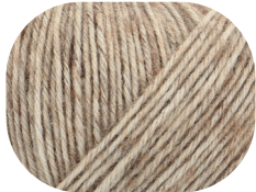
camel meliert 00020