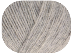
hellgrau meliert 00090